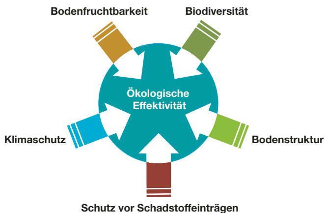
Abbildung 1: Darstellung der ökologischen Wertigkeit der Bioabfallbehandlung im Sinne einer effizienten Kreislaufwirtschaft

licher Nutzung des Kompostes zur Düngung und Bodenverbesserung wirken sich positiv auf Biodiversität, Bodenfruchtbarkeit, Schutz der Böden gegen Erosion und Mobilisierung von Schadstoffen aus (Abbildung 1, EPEA, 2008).